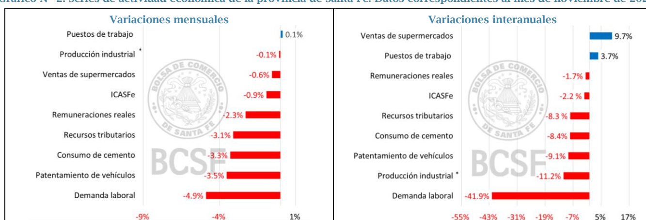
Gráfico N° 2. Series de actividad económica de la provincia de Santa Fe. Datos correspondientes al mes de noviembre de 2023.

(*) Último dato disponible: octubre 2023. Las cifras faltantes fueron estimadas.