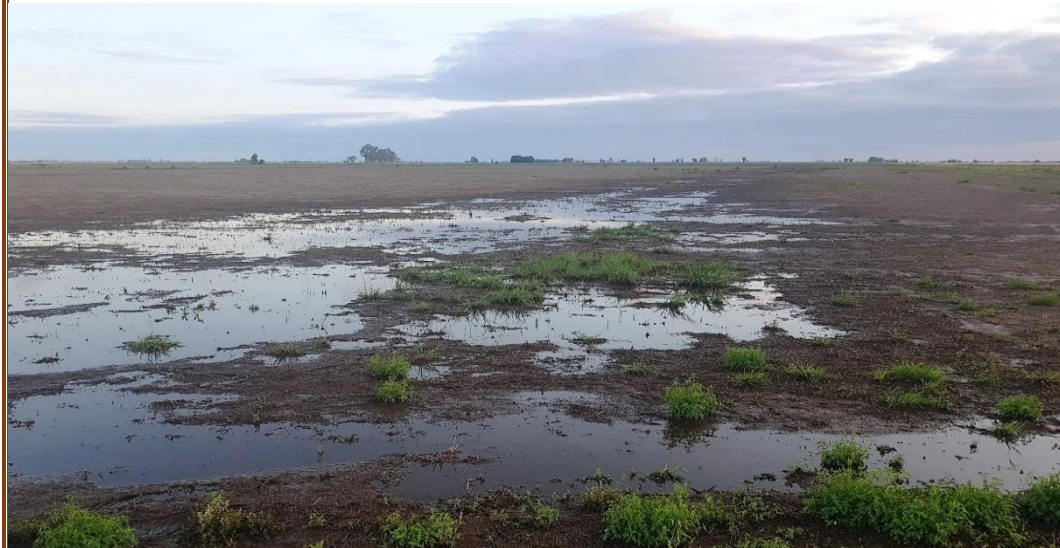
✓ Lote con rastrojo de soja tardía ; encharcado , en el centro del departamento Las Colonias .