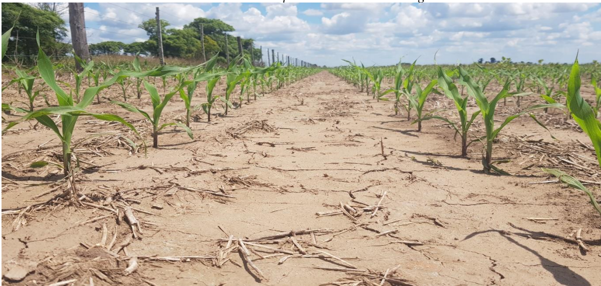
♦ Lote con maíz tardío (de segunda) ; en crecimiento y desarrollo, estado bueno a muy bueno, en el centro oeste del departamento Castellanos.