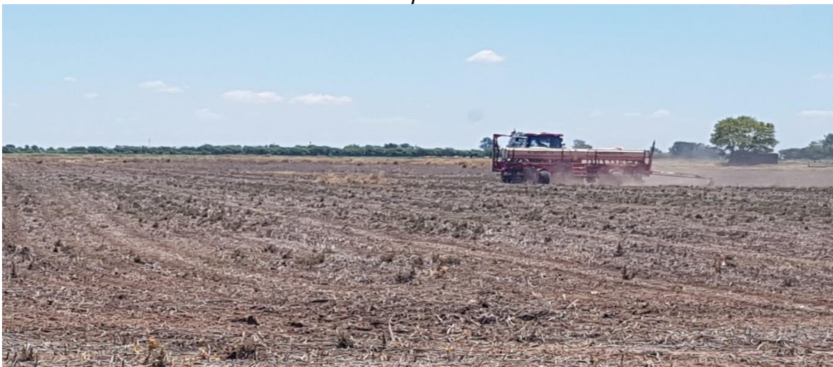
♦ Lote con rastrojo de soja (de primera) ; en pleno proceso de siembra de soja tardía (de segunda), en el centro oeste del departamento Las Colonias.