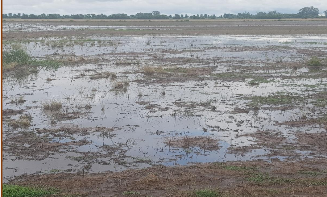
✓ Lote con rastrojo de soja tardía ; encharcado y anegado , en el centro del departamento Las Colonias .