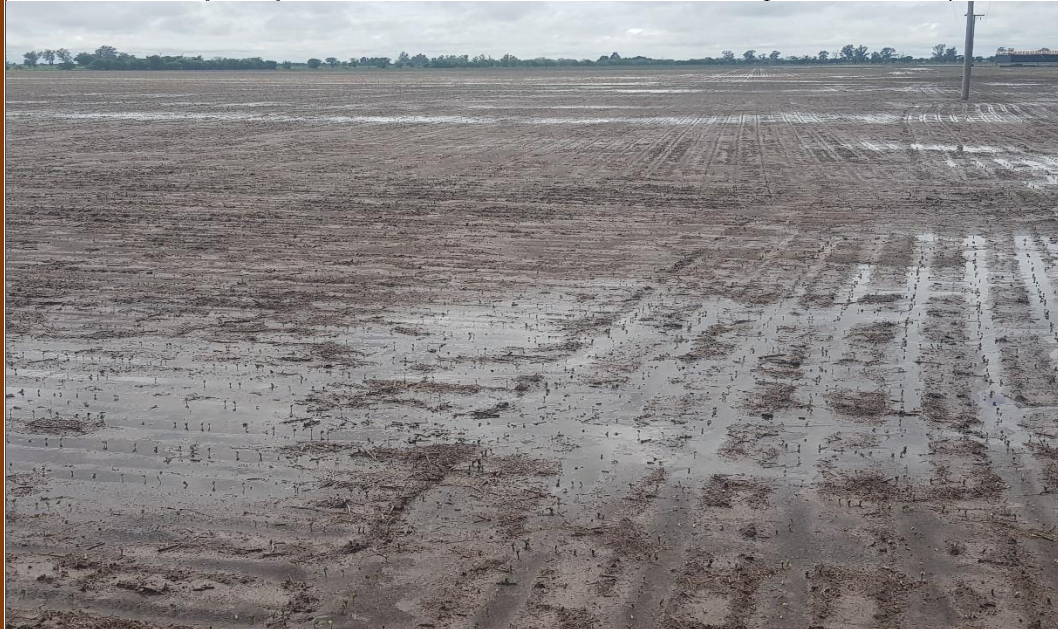
✓ Lote con soja tardía ; encharcado , en el centro del departamento Castellanos .