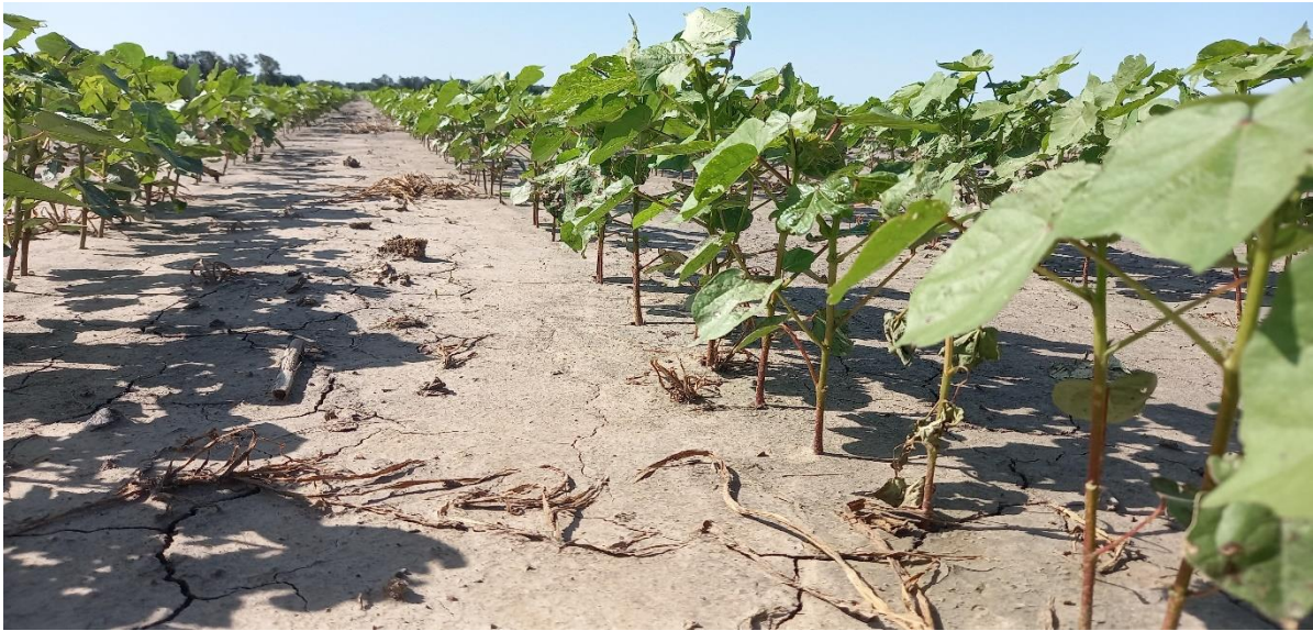
♦ Lote con algodón , en crecimiento y desarrollo, estado bueno a muy bueno, en el centro norte del departamento General Obligado.