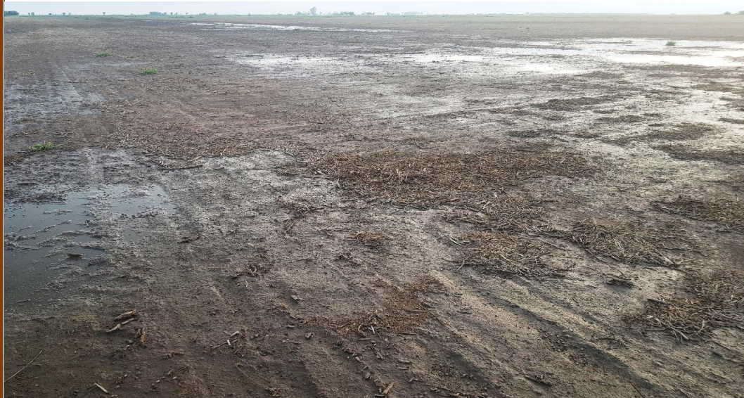
✓ Lote con rastrojo de soja tardía ; encharcado , en el centro norte del departamento La Capital .