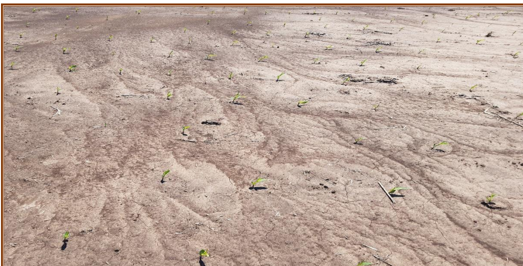
✓ Lote con maíz temprano ; proceso de erosión laminar , en el centro del departamento Las Colonias .