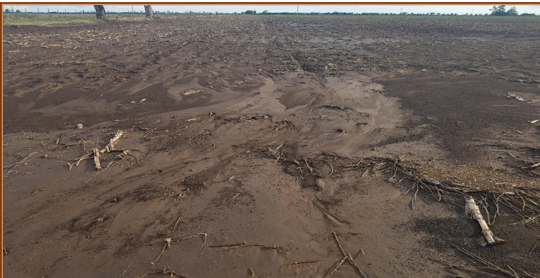
✓ Lote con maíz temprano ; proceso de erosión laminar , en el centro del departamento Castellanos .