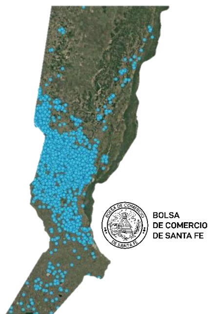
Gráfico 1. Distribución de establecimientos activos (tambos) en la provincia de Santa Fe.